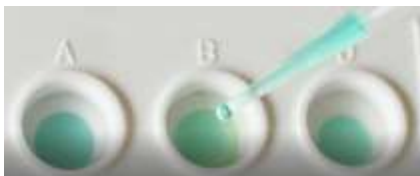
Aktivace: hydratace membrány 1 kapkou pufru

Tento jednoduchý protokol probíhá ve 3 krocích a trvá pouze 30 sekund .