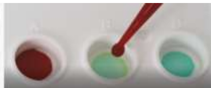
Přidání krve do jamek